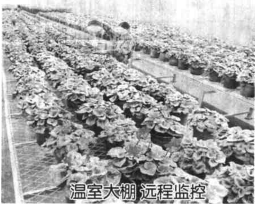
温室大棚 远程监控

哈尔滨市道里区新发镇投资100多万元兴建的现代化温室大棚日前建成。该温室大棚总面积1200平方米,拥有远程监控功能,可自动调节室内光照、温度、湿度等多项指标。