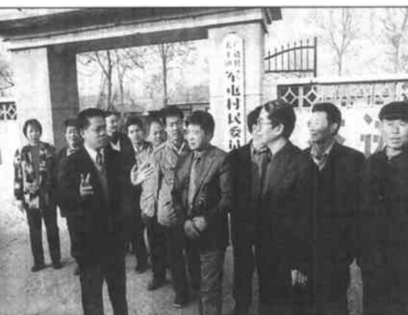
河口区农村信用社新员工在培训中认真学习，共同进步。

河口讯 近几年，河口区立足当地资源优势，大力发展芦苇、水产、冬枣和畜牧四大主导产业，壮大了产业龙头，实现了生态效益和经济效益的双赢。近年来，该区引导组织群众大力发展芦苇生产。通过招商引资；集体开发、大户承包；股份制、联合体合作开发；个人投资开发等多种形式，全区共开发苇场面积36万亩，建成了全省最大的芦苇生产加工和批发交易市场，并带起了一批苇板加工和苇帘加工企业，年创产值达3000多万元。