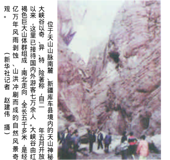
位于天山山脉南麓、新疆库车县境内的天山神秘大峡谷，以其奇特、险峻著称。自一九九一年五月开放以来，这里已接待国内外游客七万余人。大峡谷由红色褐色山体群组成，南北走向，全长五千多米，是经历亿万年的风雨冲刷、山洪冲刷而成的自然风景奇观。