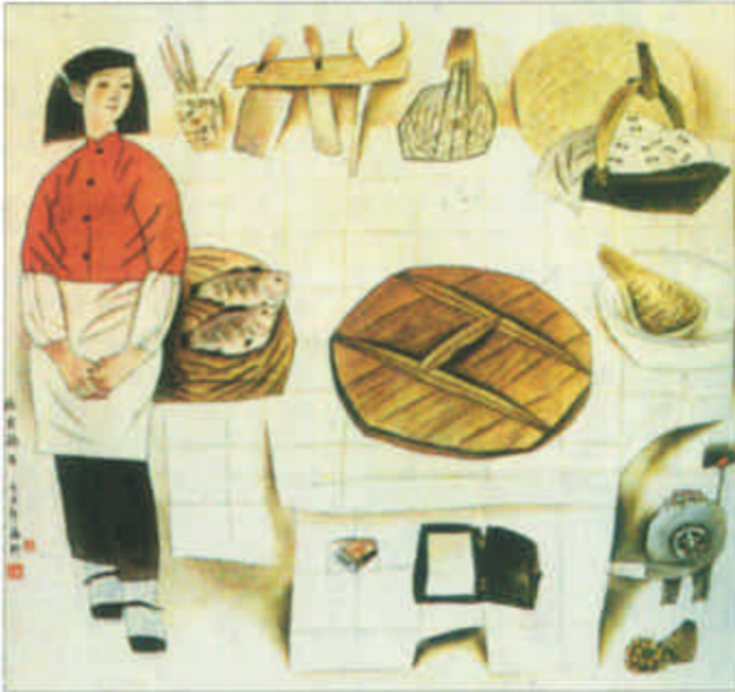
锅台 (获第七届全国美展铜牌奖) 苏耕 作

艺术是无止境，围绕在艺者身上的光环越多，从某种意义上亦证实了其作者走过艺路的蹉跎和艰辛。在此，谨以只言片语，记录下苏耕老师艺路的驿站。也谨借此文，向辛勤奋斗在书画艺术界的道友们表示敬意！