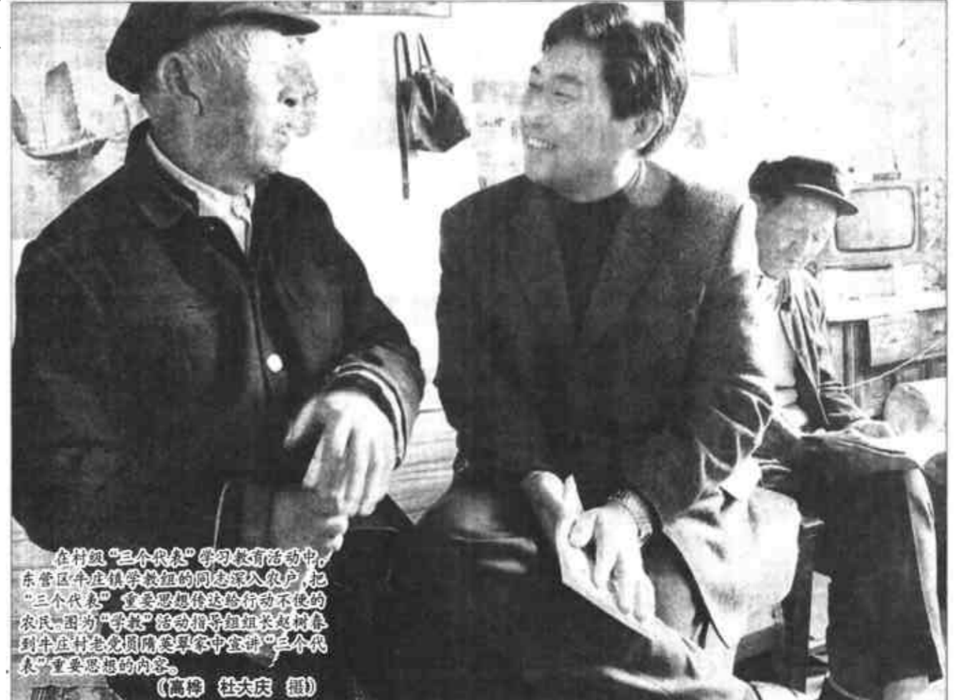
在村组“三个代表”学习教育活动中,东营区牛庄镇机关干部深入农户,把“三个代表”重要思想宣传到千家万户,为“学教”活动指导组进村入户,到户宣讲“三个代表”重要思想的内容。

营日报社三楼。 另外,为适应公司发展需要,经人才交流中心批准,我公司诚聘各方面管理、技术人才及文秘工作者,欢迎各界精英加盟。同时,欢迎有志于投资东营南港港口建设、海产养殖、旅游业的各界客商前来洽谈合作业务。 地址:东营市五台山路中段 电话:8209797 东营市南港港口建设开发有限公司